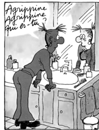
Extrait d'un album d'« Agrippine », ÉDITIONS DARGAUD BENELUX