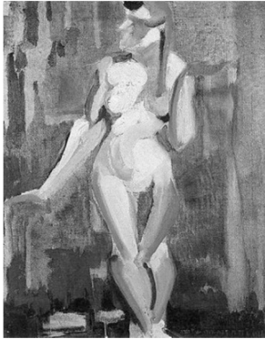
Anita Malfatti. Nu Cubista n.º 1.

Com base na obra Nu Cubista n.º 1 , de Anita Malfatti, julgue os itens a seguir.